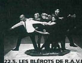
22.5. LES BLÉROTS DE R.A.V.E.L.