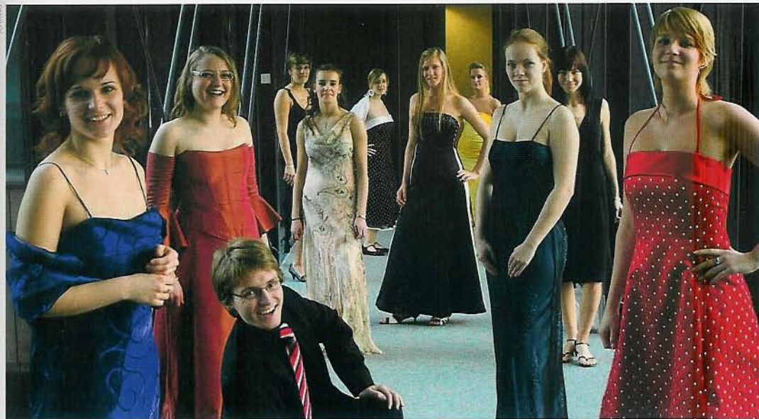
Leipziger Nachwuchshoffnung beim internationalen A-cappella-Wettbewerb: Damenensemble enchore